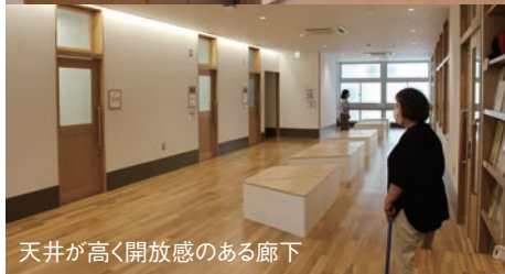
天井が高く開放感のある廊下