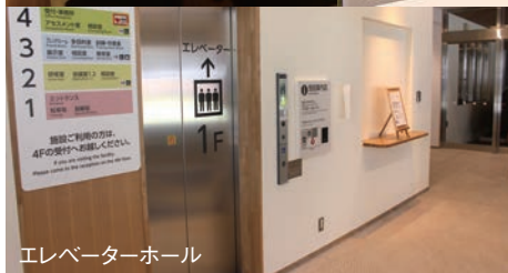
エレベーターホール

3階は、フレンドルームが2室あり、ここでフレンドホームの文化教室が実施されています。また、展示室が設けられており、発達障がいについての解説や自助具、関連グッズが展示されています。他にも発達障がい特化した訓練室や療育室も完備されています。