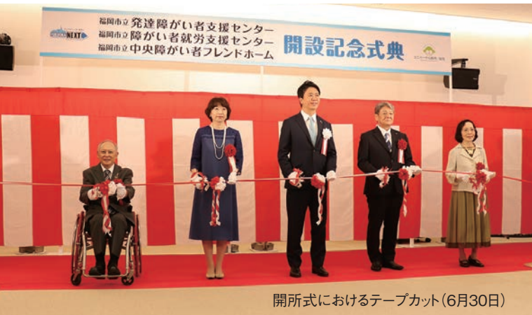
開所式におけるテープカット(6月30日)

全7階建てのこの庁舎は、外観が市の建物らしい白を基調としたすっきりとしたデザインで、内装は白地のクロス張りの壁面と床や扉は木を用いたぬくもりあるデザインが施されています。利用しやすい配慮がなされているようです。また、階段スペースは吹き抜けの全面ガラス張りで空間を最大限まで広く使い、開放感を感じさせてくれます。