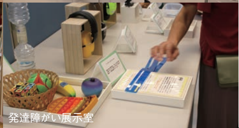
発達障がい展示室

4階は、来館者用受付、就労支援のためのアセスメント室や相談室が設けられています。ご相談や文化教室及びお部屋の利用を希望される場合は、まず4階へお越しください。 5階から7階は、福岡市関連事務所です。利用者が出入りできるのは、4階までとなります。 他にも楽しい単発教室や催し物も計画中のことです。すでに定員を満了した教室もあります。興味がある方は、まずは問い合わせしてみてください。